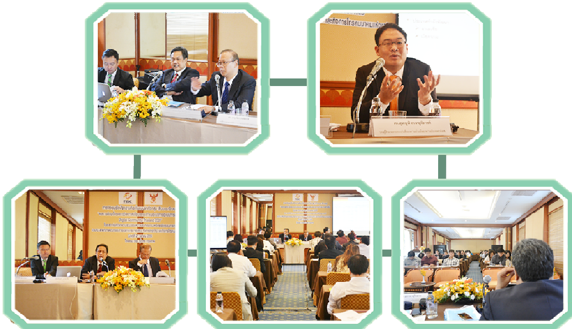
การประชุมรับฟังความคิดเห็นในวงจำกัด (Focus Group) “ผลการศึกษาโครงการวิเคราะห์นโยบายและกำหนดแนวทางดำเนินการสำหรับ Digital Community: Thailand 2020”

การจัดประชุมรับฟังความคิดเห็นในวงจำกัด (Focus Group) “ผลการศึกษาโครงการวิเคราะห์นโยบายและกำหนดแนวทางดำเนินการสำหรับ Digital Community: Thailand 2020” เมื่อวันที่ 21 ตุลาคม 2558 ณ ห้องกรรมล 1-2 ชั้น 2 โรงแรม เดอะ สุโกศล กรุงเทพฯ มีผู้เข้าร่วมการสัมมนาทั้งสิ้น 100 คน