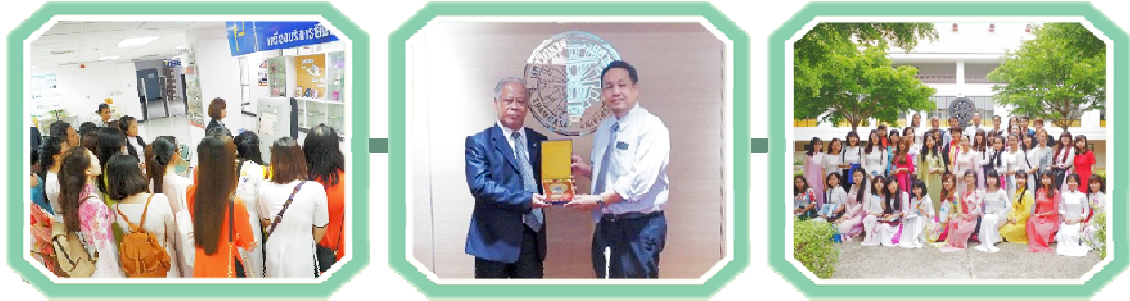
ภาพบรรยากาศในการมาเยี่ยมชมและทัศนศึกษาของคณะอาจารย์และนักศึกษาจาก The University of Social Sciences and Humanities, Vietnam National University เมื่อวันที่ 6 กรกฎาคม 2559