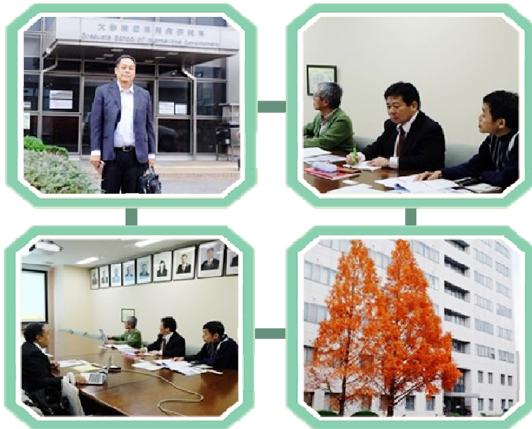
พบผู้บริหารและคณาจารย์จาก Graduate School of International Development (GSID), Nagoya University