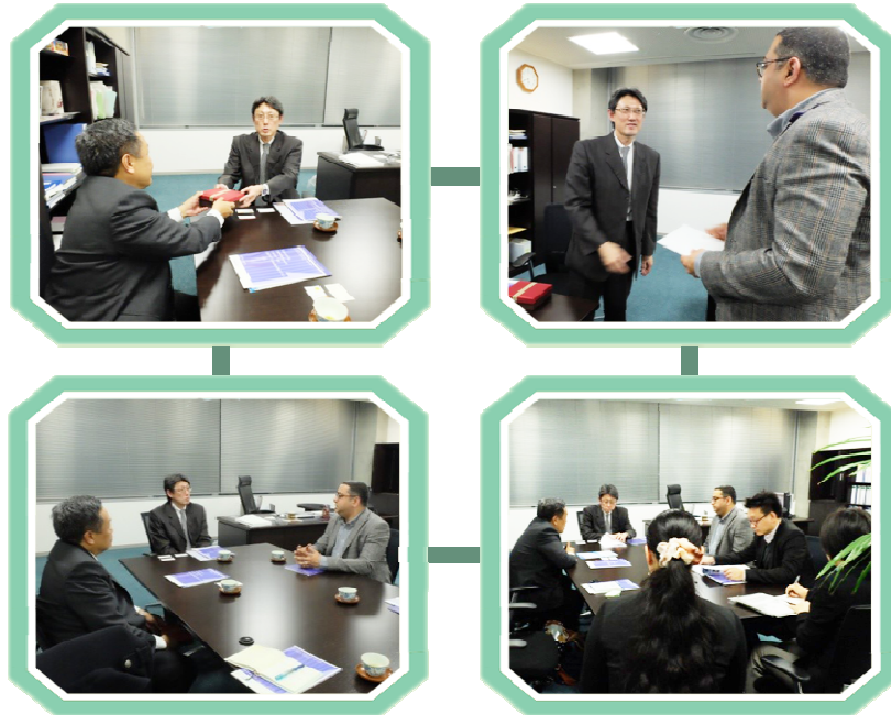
พบกับผู้บริหาร คณาจารย์ และเจ้าหน้าที่จาก National Graduate Institute for Policy Studies (GRIPS)