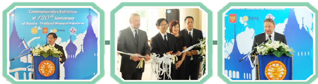
งานนิทรรศการ 120 ปี ความสัมพันธ์ไทย-รัสเซีย

2.3 ขยายขอบเขตการดำเนินกิจกรรมของสถาบันฯ ให้ครอบคลุมถึงความร่วมมือระหว่างประเทศในภูมิภาค ตามยุทธศาสตร์แนวทางการพัฒนาอันเป็นเจตนารมณ์ที่สำคัญของสถาบันฯ เพื่อให้เกิดการประสานความร่วมมือในลักษณะเครือข่ายทางวิชาการ (Academic Network) ทั้งในประเทศและต่างประเทศ