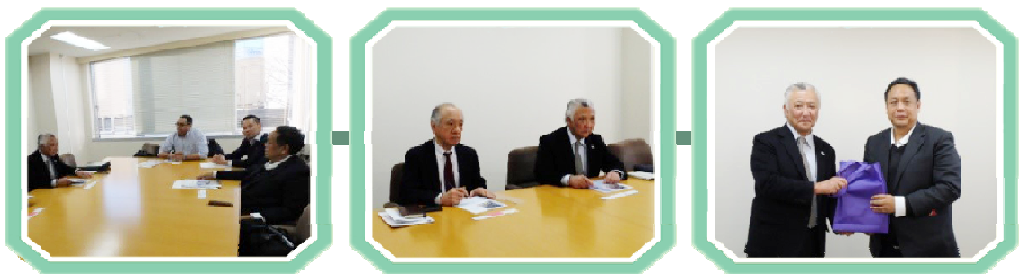
พบกับผู้บริหารและอาจารย์ ณ School of Political Science and Economics, Meiji University