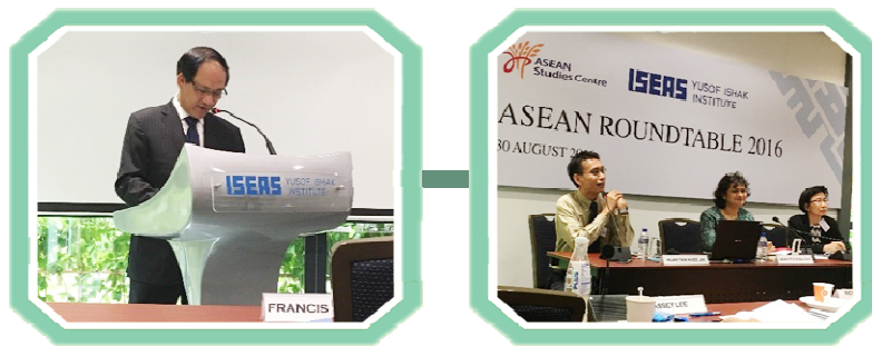
ร่วมการสัมมนา ASEAN Roundtable 2016 “The ASEAN Economic Community Toward 2025”