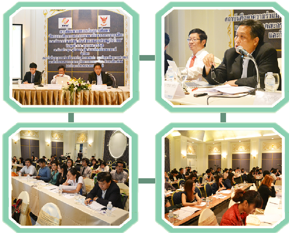
การจัดสัมมนาเพื่อเผยแพร่ผลการศึกษา “โครงการศึกษาผลกระทบของกิจการกระจายเสียงและกิจการโทรทัศน์ต่อสังคมและเศรษฐกิจไทย”

การจัดสัมมนาเพื่อเผยแพร่ผลการศึกษา “โครงการศึกษาผลกระทบของกิจการกระจายเสียงและกิจการโทรทัศน์ต่อสังคมและเศรษฐกิจไทย” เมื่อวันที่ 14 ตุลาคม 2558 ณ ห้องประชุมจูปีเตอร์ 16 อาคารชาเลนเจอร์ ชั้น 1 อิมแพ็ค เมืองทองธานี จังหวัดนนทบุรี จำนวน 81 คน