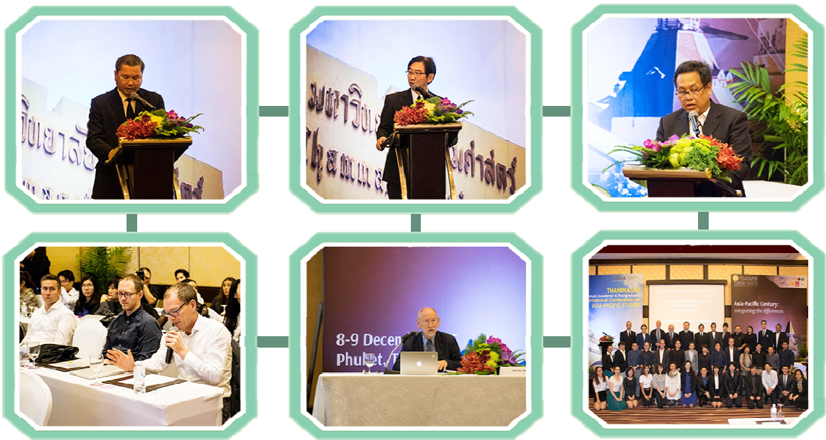
การจัดประชุมวิชาการระดับนานาชาติ Thammasat Annual Academics and Post-Graduate Conference on Asia Pacific Studies (TU-CAPS) ภายใต้หัวข้อเรื่อง 2016 “Asia-Pacific Century: Integrating the Differences”

ทั้งนี้ มีนักวิชาการที่เข้าร่วมงานจากมหาวิทยาลัย 9 แห่งใน 5 ประเทศ ประกอบไปด้วย Australian National University ประเทศออสเตรเลีย Copenhagen Business School ประเทศเดนมาร์ก CityPERC & University of Canada ประเทศแคนาดา Waseda University, Meiji University, National Graduate Institute for Policy Studies (GRIPS), Yokohama City University ประเทศญี่ปุ่น และมหาวิทยาลัยในประเทศจาก มหาวิทยาลัยธรรมศาสตร์ จุฬาลงกรณ์มหาวิทยาลัย และมหาวิทยาลัยหอการค้าไทย ทั้งหมดจำนวน 21 คน สำหรับนักศึกษาปริญญาโทและปริญญาเอกที่เข้าร่วมงานจาก Waseda University ประเทศญี่ปุ่น De La Salle University, University of Cebu ประเทศฟิลิปปินส์ นักศึกษาปริญญาโท โครงการเอเชียแปซิฟิกศึกษา จากมหาวิทยาลัยธรรมศาสตร์ ทั้งหมดจำนวน 18 คน