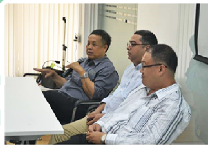
ภาพบรรยากาศการปฐมนิเทศนักศึกษาใหม่ วันที่ 14 สิงหาคม 2559