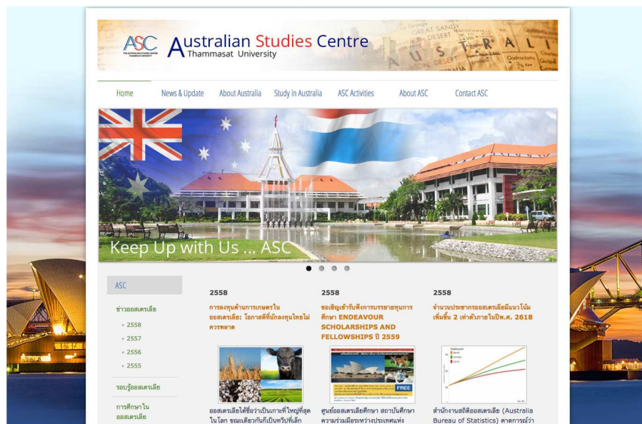
หน้าแรก (Home) ของเว็บไซต์ www.aussiecenter.org

ทางสถาบันฯ ได้รับเงินทุนสนับสนุนในการปรับปรุงเว็บไซต์บางส่วนจากสถาบัน Australian Thailand Institute (ATI) เป็นเงิน 60,000 บาท เพื่อสร้างและปรับปรุงฐานข้อมูลในส่วนของ “รู้จักออสเตรเลีย” ซึ่งเป็นข้อมูลเพิ่มเติมให้กับครูผู้สอนในระดับมัธยมที่เข้าร่วมในการอบรมครูที่ผ่านมา