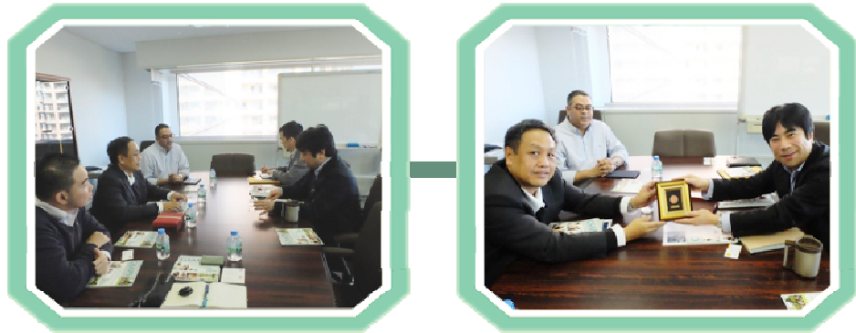
พบกับคณะผู้บริหาร Graduate School of Asia-Pacific Studies (GSAPS), Waseda University