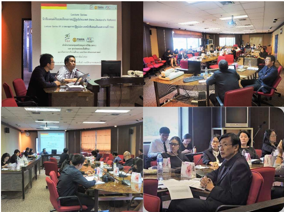
Lecture Series ภาพรวมการปฏิรูปประเทศนิวซีแลนด์ในทศวรรษที่ 1980

การจัดสัมมนาเพื่อเผยแพร่ผลการศึกษา “โครงการศึกษาและสร้างผู้เชี่ยวชาญเฉพาะพื้นที่ : กรณีศึกษาออสเตรเลียและนิวซีแลนด์” Lecture Series เรื่อง “นิวซีแลนด์กับบทเรียนการปฏิรูปประเทศ (New Zealand’s Reform)” จำนวน 2 ครั้ง ครั้งที่ 1 วันพุธที่ 22 กุมภาพันธ์ 2560 และ ครั้งที่ 2 วันพุธที่ 1 มีนาคม 2560 ณ ห้องประชุม F332 ชั้น 3 อาคารอเนกประสงค์ 2 (อาคารธรรมศาสตร์ 60 ปี) มหาวิทยาลัยธรรมศาสตร์ ท่าพระจันทร์