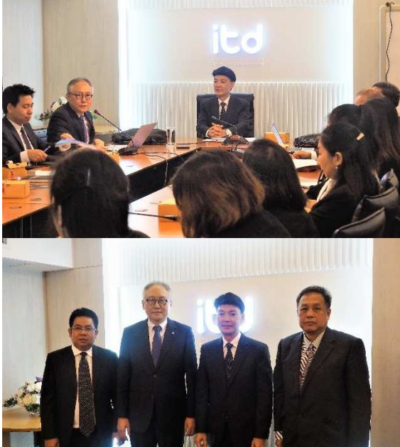
งานสัมมนาวิชาการ หัวข้อ “FTA Strategy and Institutional Concerns, FTA Negotiation and Implementation of the Republic of Korea”