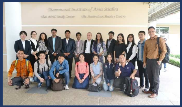
คณะนักศึกษาและอาจารย์จาก Youth for Human Rights International (Leiden University) มาเยี่ยมชมศูนย์อินเดียศึกษา สถาบันอาณานิคมศึกษา