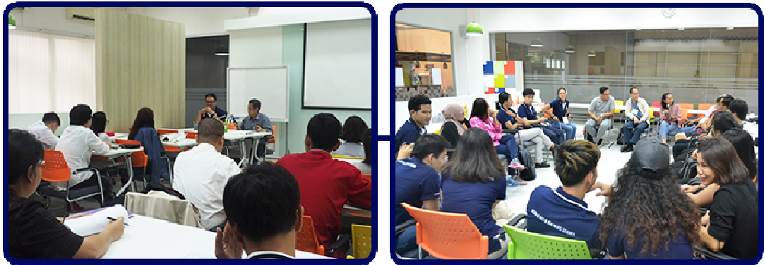
ภาพบรรยากาศการปฐมนิเทศนักศึกษาใหม่ วันที่ 11 สิงหาคม 2560