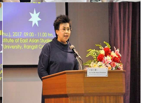
ปาฐกถาเรื่อง “Australia's Foreign Policy”