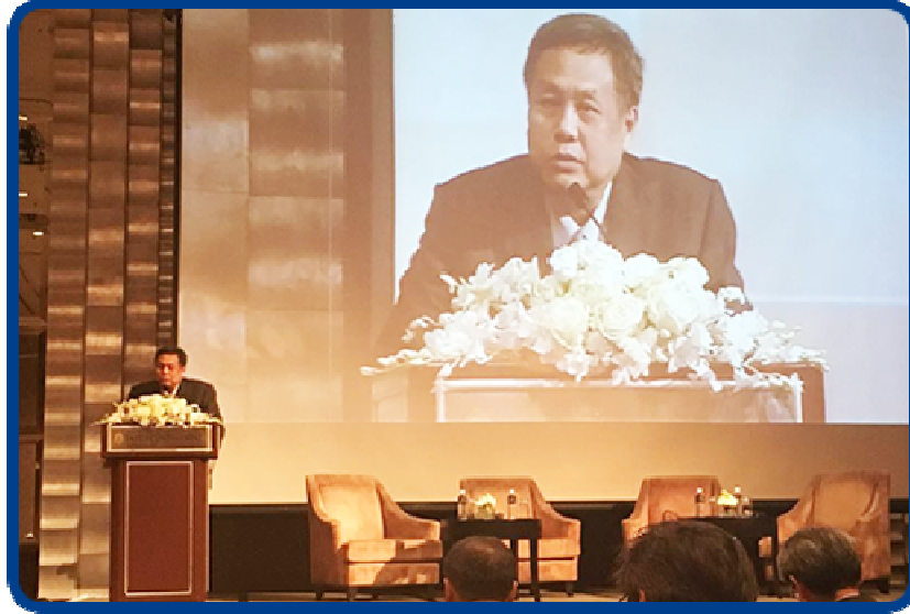
งานเสวนา เรื่อง “High-Speed Railway and the Landscape of Eastern Economic Corridor 2030”