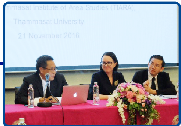
การประชุมสัมมนานานาชาติ “ASEAN and Russia in the Changing Regional and Global Environment: Views from Russia and Thailand”