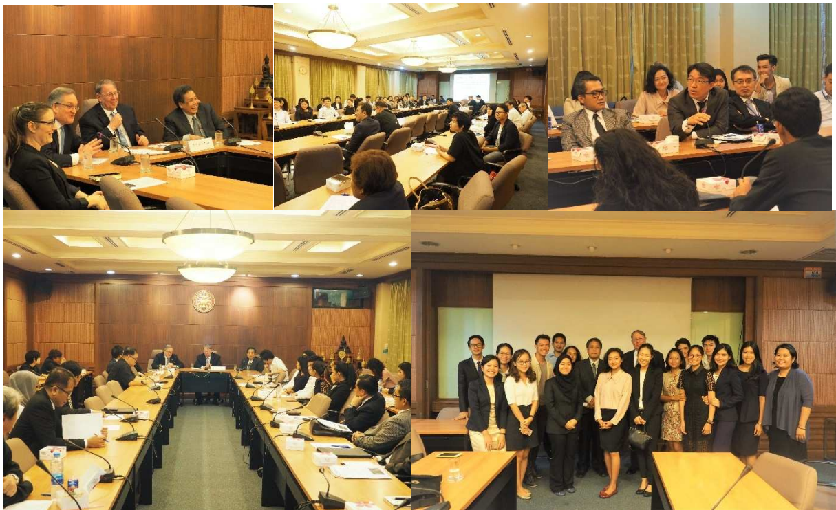
การบรรยาย เรื่อง “Australian Perceptions of the North Korean Crisis and the Pacific Rim”