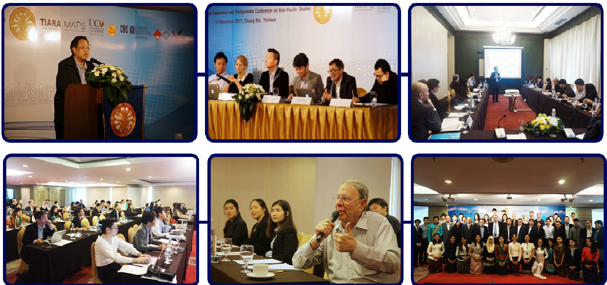
การจัดประชุมวิชาการระดับนานาชาติ Thammasat Annual Academics and Post-Graduate Conference on Asia Pacific Studies (TU-CAPS) 2017 ภายใต้หัวข้อเรื่อง “Asia-Pacific: World’s New Focal Point”

สำหรับนักศึกษาปริญญาโทและปริญญาเอกที่เข้าร่วมงานจาก Waseda University ประเทศญี่ปุ่น University of Canterbury ประเทศนิวซีแลนด์ นักศึกษาปริญญาโท หลักสูตรเอเชียแปซิฟิกศึกษาจากมหาวิทยาลัยธรรมศาสตร์ และมหาวิทยาลัยแม่ฟ้าหลวง จำนวนทั้งสิ้น 23 คน