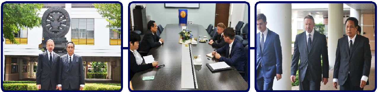
H.E. Kiril Barskey เอกอัครราชทูตสหพันธรัฐรัสเซียประจำประเทศไทย เข้าร่วมหารือเรื่องความร่วมมือทางวิชาการ

H.E. Kiril Barskey เอกอัครราชทูตสหพันธรัฐรัสเซียประจำประเทศไทยได้เดินทางมาหารือเรื่องความร่วมมือทางวิชาการกับสถาบันอาณานิคมศึกษาเมื่อวันที่ 21 ตุลาคม 2559