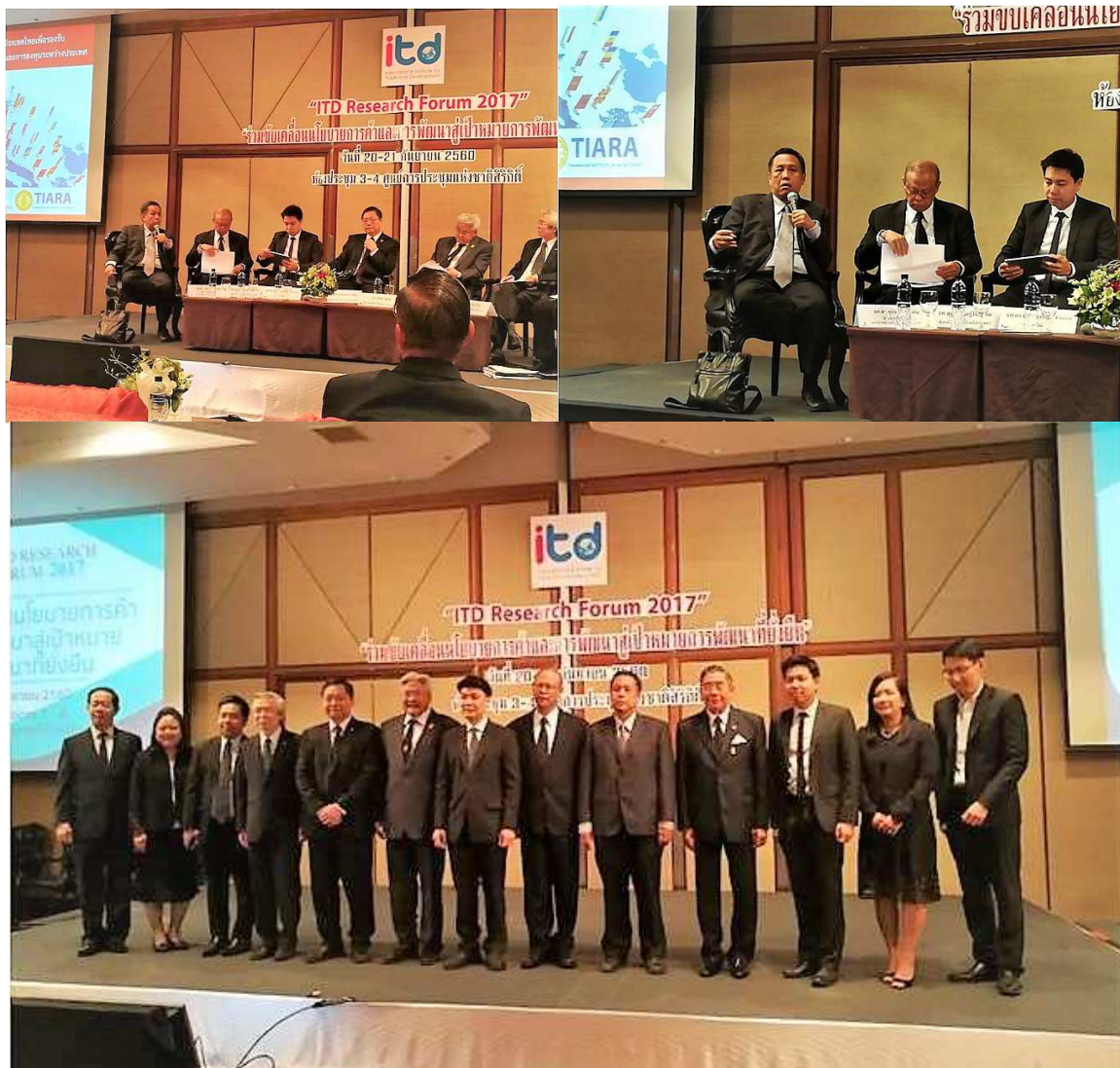
การสัมมนาประจำปี ITD Research Forum 2017 ในหัวข้อ “ร่วมขับเคลื่อนนโยบายการค้าและการพัฒนาสู่เป้าหมายการพัฒนาที่ยั่งยืน”

สถาบันอาณานิคมศึกษา มหาวิทยาลัยธรรมศาสตร์ และสถาบันระหว่างประเทศเพื่อการค้าและการพัฒนา ได้จัดสัมมนาวิชาการเพื่อเผยแพร่ผลงานในการสัมมนาประจำปี ITD Research Forum 2017 ในหัวข้อ “ร่วมขับเคลื่อนนโยบายการค้าและการพัฒนาสู่เป้าหมายการพัฒนาที่ยั่งยืน” ในวันที่ 20 กันยายน 2560 ณ ห้องประชุม 3-4 ศูนย์การประชุมแห่งชาติสิริกิติ์