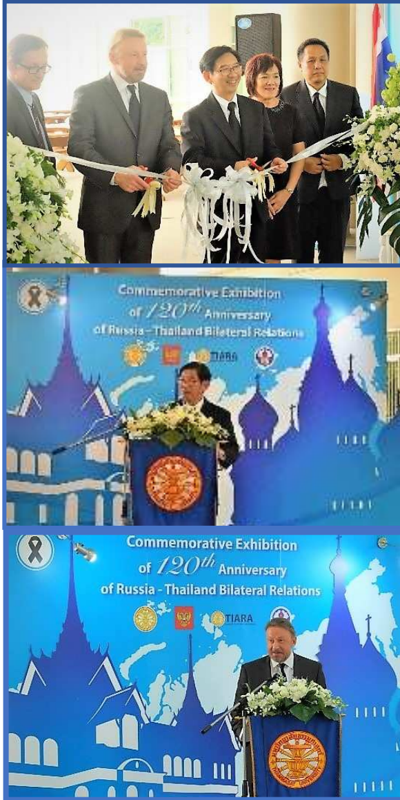
งานนิทรรศการ 120 ปี ความสัมพันธ์ไทย-รัสเซีย

ศูนย์ศึกษารัสเซียและเครือรัฐเอกราช สถาบันอาณานิคมศึกษา และสำนักงานวิเทศสัมพันธ์ มหาวิทยาลัยธรรมศาสตร์ ร่วมกับสถานเอกอัครราชทูตสหพันธรัฐรัสเซียประจำราชอาณาจักรไทย จัดงาน “นิทรรศการ 120 ปี ความสัมพันธ์ไทย-รัสเซีย” ณ มหาวิทยาลัยธรรมศาสตร์ ศูนย์รังสิต เมื่อวันที่ 22 พฤศจิกายน 2559 ทั้งนี้ H.E. Kiril Barskey เอกอัครราชทูตสหพันธรัฐรัสเซีย และท่านอธิการบดี มหาวิทยาลัยธรรมศาสตร์ ร่วมให้เกียรติเป็นประธานเปิดนิทรรศการดังกล่าว