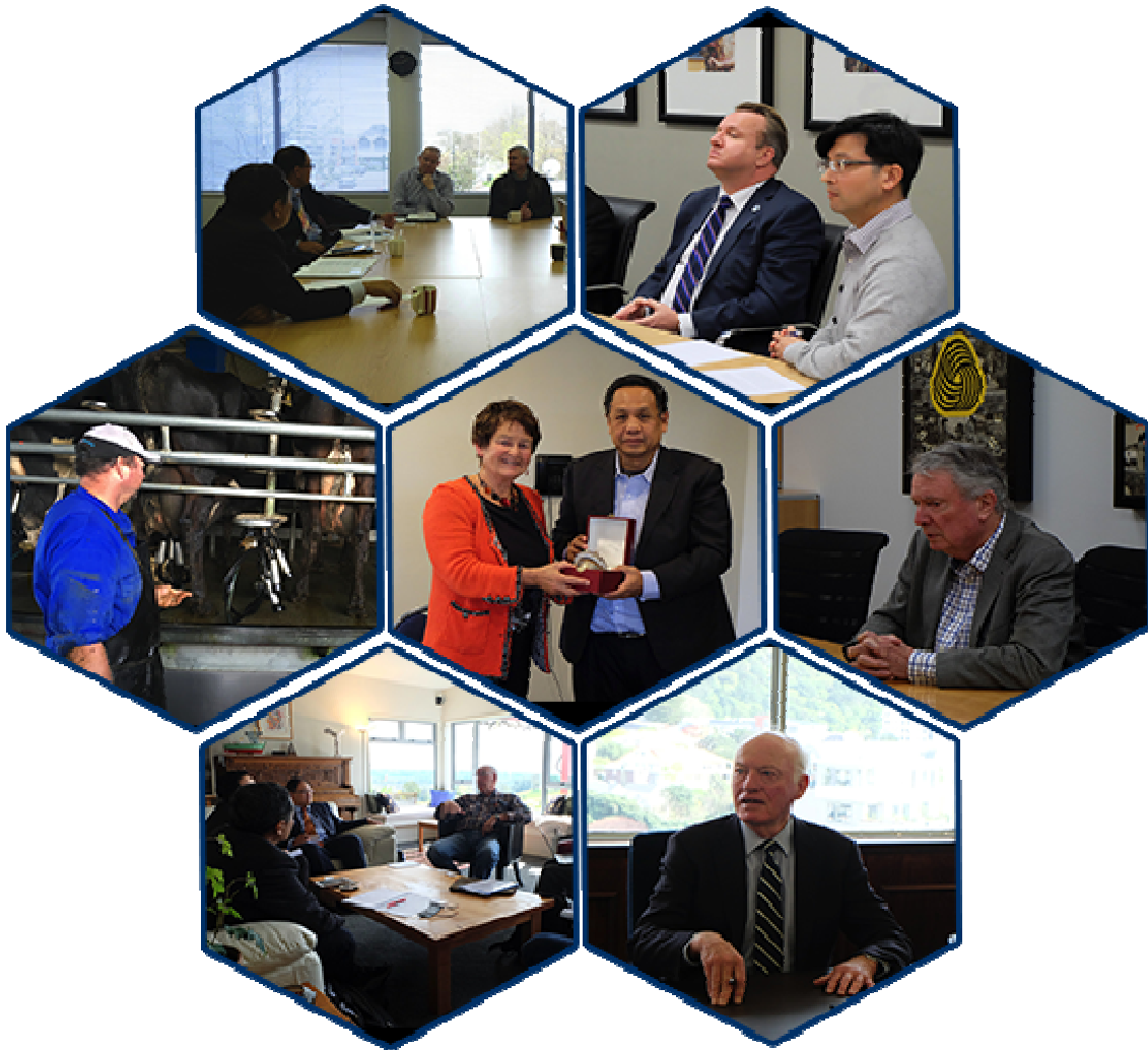
การเดินทางเก็บข้อมูลและสัมภาษณ์ โครงการศึกษาและสร้างผู้เชี่ยวชาญเฉพาะพื้นที่ กรณีศึกษาออสเตรเลียและนิวซีแลนด์ ณ ประเทศนิวซีแลนด์