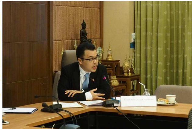
งานบรรยาย เรื่อง “Enduring Determinants in Thai-Russian Relations”