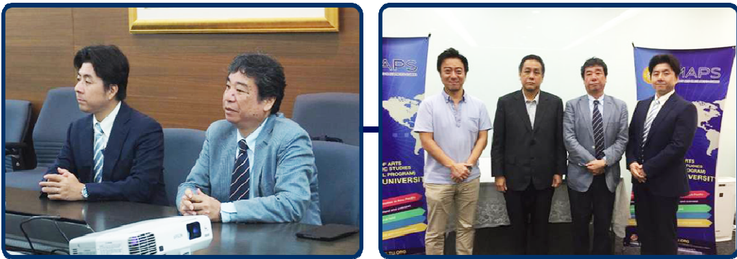
ผู้บริหารจาก จาก Department of Economics, School of Political Science and Economics, Meji University เข้าพบหารือในวันที่ 22 สิงหาคม 2560